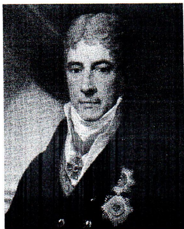
Рис. 2. Граф Андрей Кириллович Разумовский (1752–1836) – русский посол в Неаполе, Швеции, Австрии. Портрет работы И.-Б.Ламти, 1810-е.