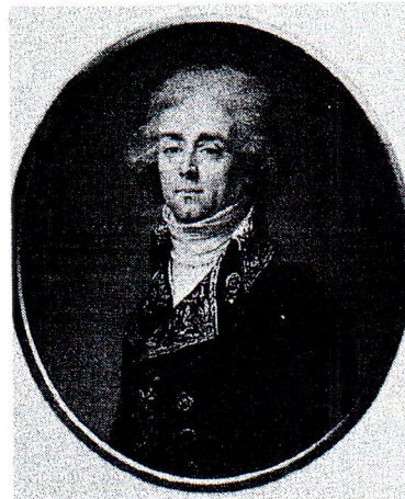
Рис. 4. Граф Юрий Александрович Головкин (1762–1846) – сенатор, посол в Китае и Австрии, обер-камергер.

ства средних учебных заведений. Благодаря протекции графов Разумовских О.О.Реман в кратчайший срок получил разрешение на врачебную практику и с «высочайшего соизволения» 2 апреля 1805 г. был определен врачом при посольстве в Китай во главе с графом Ю.А.Головкиным. Под предлогом уведомления китайского императора о вступлении на престол Александра I Ю.А.Головкин (рис. 4) должен был добиться доступа русских торговых судов в Кантон, открытия торговли по сухопутной границе с Северо-Западным Китаем, судоходства по Амуру, необходимого для снабжения провиантом и оружием русских владений на Камчатке и Аляске.